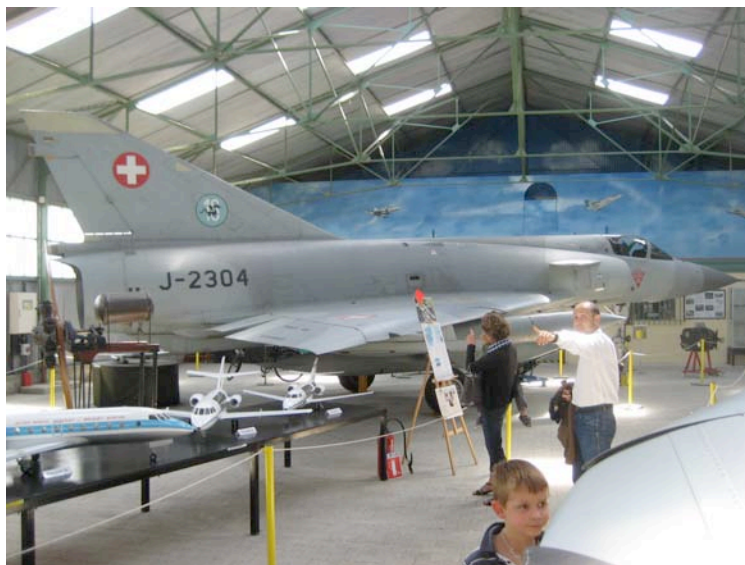
Mirage offert par l'armée Suisse au musée

Le repas de midi n'était pas fantastique, malgré la propagande de repas terroir.