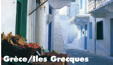
Grèce / Iles Grecques