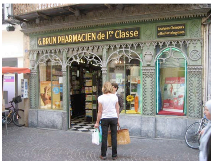
Magnifique pharmacie au centre de Montélimar

À notre arrivée, c'est plusieurs amis que nous avons retrouvés. Malgré l'absence des organisateurs, nous avons offert l'apéro pour mouiller une fois de plus notre nouveau véhicule. Sympathiques moments à trinquer et à refaire les aires de service, les articles sur la bricole enfin, la présentation de notre journal préférée sous les pins et le ciel dégagé.