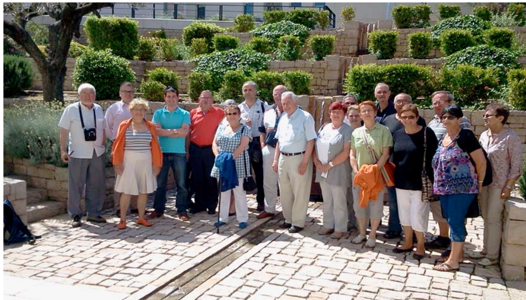
Une partie des correspondants à Montélimar

J'ai rencontré les rédacteurs et les correspondants du journal Le Monde du Camping-car.