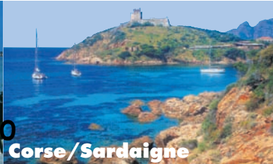
Corse / Sardaigne