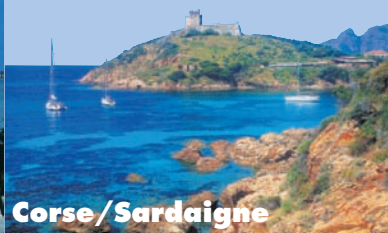
Corse / Sardaigne