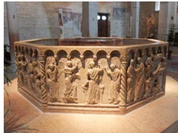
Un baptistère qui doit avoir des histoires

Belle virée toutefois grâce à passablement de soleil et d'amitiés.