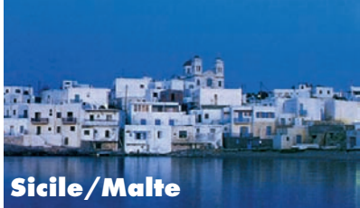
Sicile / Malte