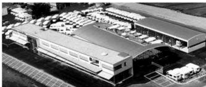
magasin, atelier, agence Fiat, cafétéria, borne euro-relais, station de lavage

Tél. 021 731 91 91 Fax 021 731 91 99 E-mail: info@bw-sports.ch www.bw-sports-loisirs.ch