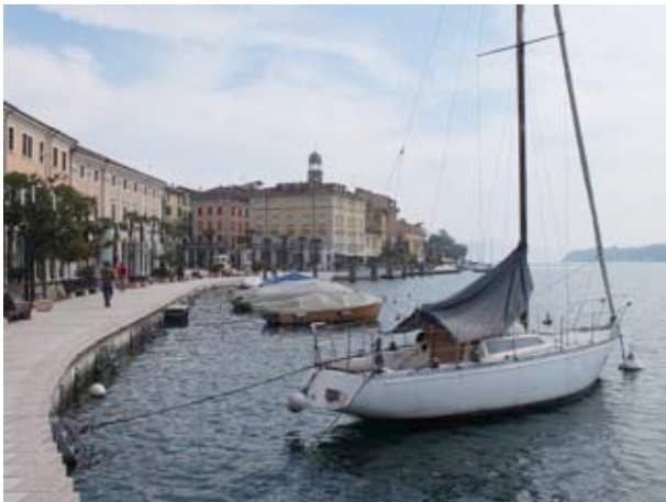
Au bord du lac de Garde