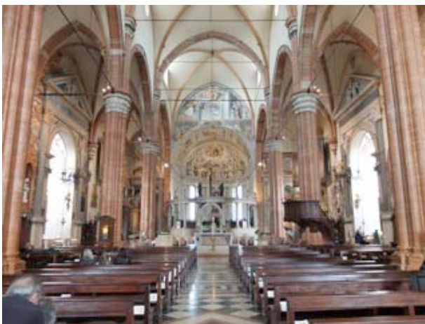
Le dôme de Vérone, incontournable