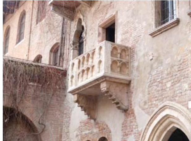
Le balcon de Roméo et Juliette

Afin de suivre une route à notre convenance, on décide de prendre le départ aux environs de neuf heures. Puis en route pour le lac d'Iseo pour un arrêt à Iseo même. Pas un emplacement n'est autorisé pour les CC. Afin de jouir du bonheur de nous rendre au marché on pose nos roues au camping tout proche. D'ailleurs, cela nous permet d'aller faire un tour en ville.