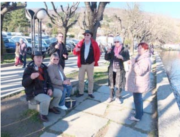
L'apéro à Gavirate

Notre destination pour les jours suivants se passe au bord du lac de Garde dans un camping de Sirmione. Visite de la péninsule de Sirmione et de la Villa di Catullo. Magnifique visite mais quelque peu pénalisée par la quantité de visiteurs.