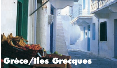
Grèce / Iles Grecques