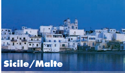
Sicile / Malte