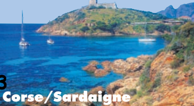
Corse / Sardaigne