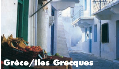
Grèce / Iles Grecques