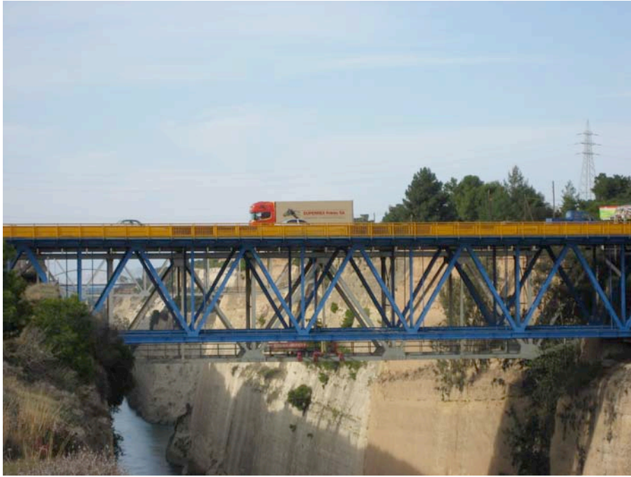
Au-dessus du canal de Corinthe

Nous avons rendez-vous à l'hôtel intercontinental en fin de journée, on s'y rend sans tarder non sans avoir fait un petit crochet chez HARRIS, relais routier de la ville qui ne nous incite surtout à ne pas à y rester malgré que tous les routiers n'en parlent qu'en bien... Bizarre, nous, on repart car les peu rassurantes explications sur la ville d'Athènes et les difficultés à y trouver son chemin à travers des rues à sens uniques et larges nous poussent à nous rendre sans tarder à notre destination. Bien nous en a pris, déjà plusieurs véhicules attendent pour décharger leurs colis aussi volumineux que les nôtres. Avec malice, nous réussissons à nous garer dans une en casse que nous garderons jusqu'à notre départ quelques 4 jours plus tard.