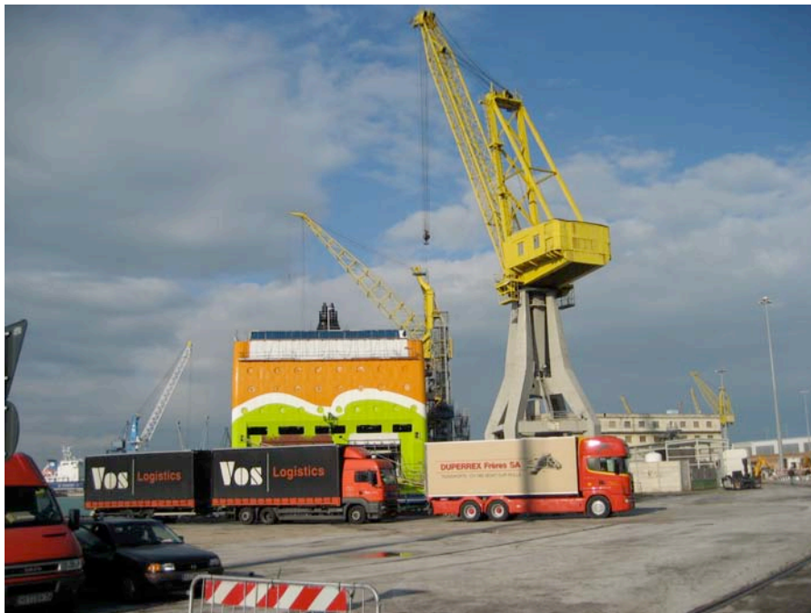
Les premiers avant l'embarquement

Après un repos sur l'autoroute, nous enfilons les derniers kilomètres pour nous retrouver au bord de la mer, directement à l'endroit de notre embarquement. La discussion que nous avons avec l'hôtesse de la compagnie qui nous emmènera en Grèce nous permet de savoir que le temps nous est largement compté. Il est 12h00 et nous chargeons seulement à 17h00.