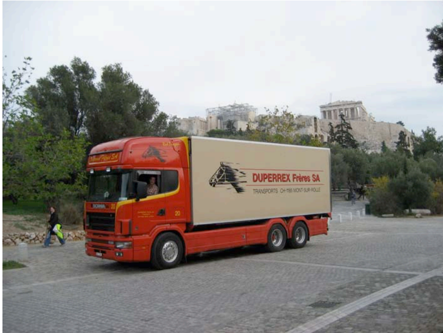
Au pied du Parthénon

Bien sur, un arrêt à Corinthe est obligatoire, nous prendrons des photos impressionnantes et majestueuses. Malheureusement nous n'aurons pas pris le temps de visiter ses antiquités que sont le temple d'Apollon et les ruines du temple de Zeus.