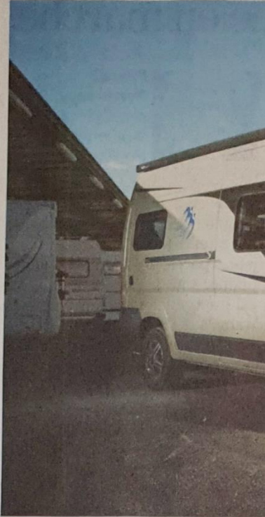
Pour visiter le pays durant les v

En conclusion j'aimerais lancer un vibrant appel à nos Communes et à Suisse Tourisme afin qu'ils considèrent l'impact positif que le camping-carisme pourrait avoir. Comme moi, si je ne peux pas me poser