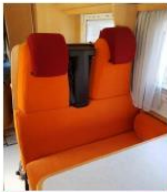
Housses de sièges