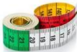
Travail sur mesure

Confection sur mesure et rénovation de qualité de votre intérieur de camping car!