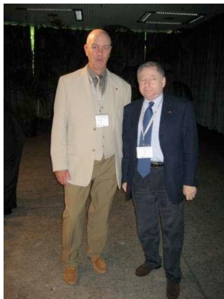
Les Présidents FICM et FIA

Il n'y a plus qu'à participer au cocktail de bienvenue afin de remplir la tâche en entier. Caché derrière mon pot de fleur j'observe ce qui se passe... non de tonnerre, mes deux gaillards se sentent comme chez eux, ils serrent des poignées de mains à tout va.