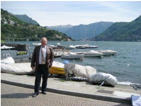
Le lac de Come

Aie, cela se complique, ils entrent dans un hôtel de premier ordre, de magnifiques voitures trônent aux alentours et des gaillards en costume cravate se congratulent. Cela doit être les autorités de tous les états du monde car si en générale ils parlent l'anglais, il en est qui parlent des langues que je ne connais même pas. Cela doit être des langues d'Asie ou autres.