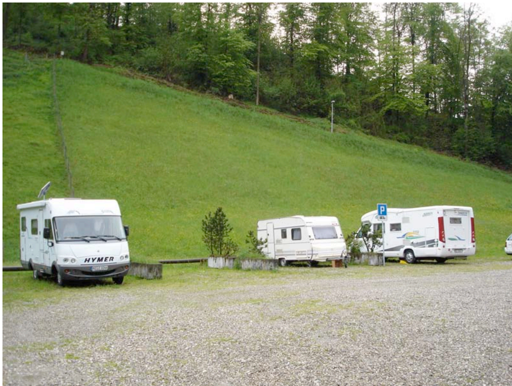
Il a l'air d'être vraiment calme !