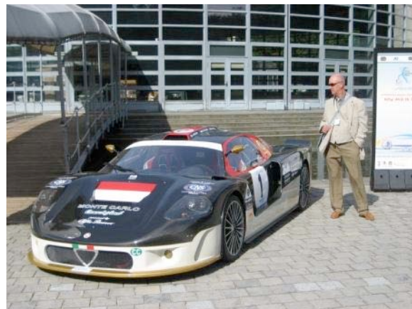
Une voiture d'exception

En attendant, mes deux gaillards sont allés dans un camping ce n'est pas des huiles eux, mais ils sont là et certainement qu'ils ont une bonne raison. Soyons patients et attendons planqué derrière les magnifiques palmiers garnis de bananes.